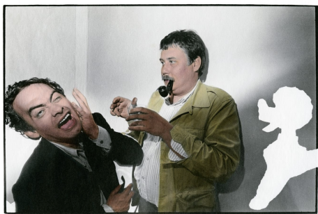
Roland Topor et Erik Dietman, 1976